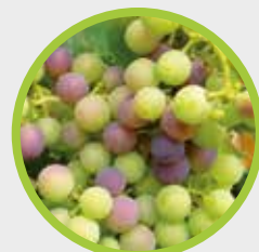
CRECIMIENTO DE FRUTO Y PINTA (ENVERO)